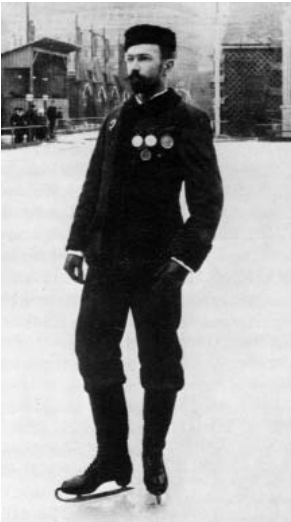
Eduard Engelmann (um 1895)