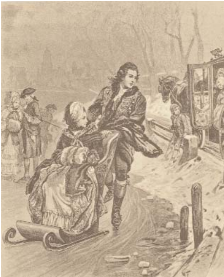
Johann Wolfgang Goethe bei einer Schlittfabrt am Eis in Frankfurt

der Zeit, da Goethe das Eislaufen lernte, im Jahre 1772, schon gewisse einfache “Kunststücke” im Schlittschuhlauf gab, lehnte Goethe diese ausdrücklich ab. Was ihnen den Eislauf wert machte, war das freie, beseligende Gefühl des Losgelöstseins von den Banden der irdischen Schwere; das genossen sie und besangen es begeistert.