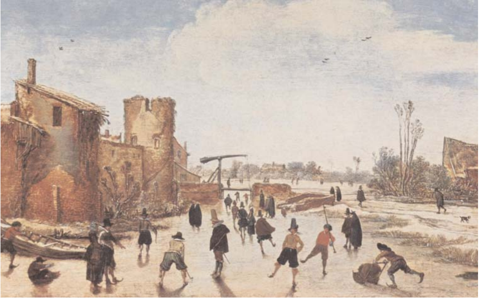
Eislaufszene des holländischen Malers van de Velde

einen kleinen Kreis von Adeligen und Höflingen beschränkt.