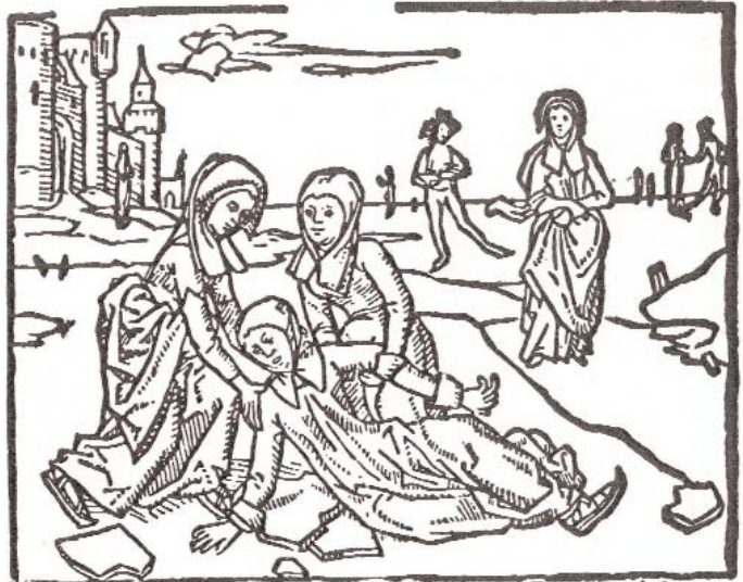
Holzchnitt aus der "Vita Lydvinae" von 1498 - die erste Darstellung einer Eislaufszene.

¶ De principio infirmitatū eius: et quō a medicis de- D icta sit. Ca m . scdm. Anno etatis sue āno. xv. vel circiter agguata ē manus dñi sup eā: nā delecta plixi lāguoris graue die facta est facies eius squalida: recessit decore eius p̄mus adeo vt sp̄nerent eā qui prius nūnio amore capti fuer