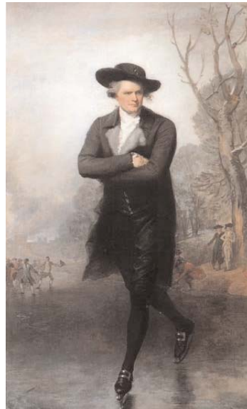
Gilbert Stuart American: The Skater (1782)