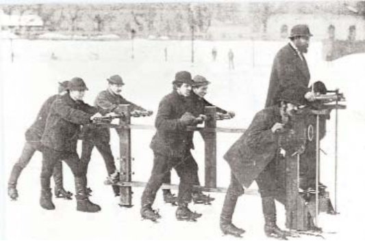
Ab 1880 wurde das Eis der Kunsteisbahn Engelmann mit einem "Eishobel" bearbeitet.

Seine Kinder, ein Knabe und ein Mädchen, wurden unter diesen Verhältnissen unvergessliche Künstler, Meister auf dem Eise. Eduard Engelmann jun. wurde Mitbegründer der Wiener Schule, die im höchsten sportlichen Ansehen der ganzen Welt stand.