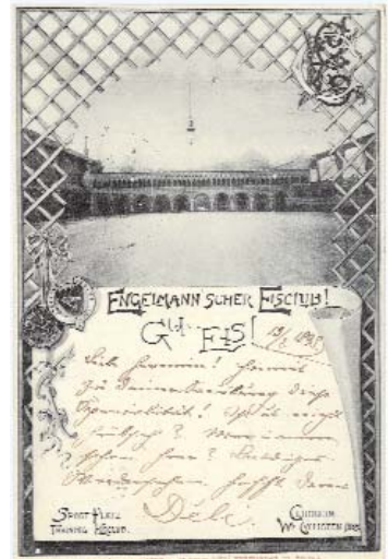
Postkarte mit den Lauben des Eis.sportklubs Engelmann im Jahr 1898.

einer Eisbahn im Hausgarten in Hernals, Alsgasse 8" (heute Jörgerstraße), ausgestellt. Eine Spritzeisfläche um einen alten Nussbaum herum genügte zunächst einer kleinen Schar von Verwandten und Freunden der Familie Engelmann dem Eissport zu huldigen.