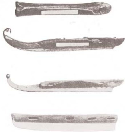
von oben: Knochenschlittschuh, Schlittschuh zu Beginn des 18. Jahrhunderts, Schlittschuh aus Deutschland um 1800, englisches Schlittschuhmodell um 1850

Die entscheidende Umwälzung auf diesem Gebiet bahnte sich im Jahre 1850 durch die Erfindung des ersten holz- und riemenlosen Ganzmetallschlittschuhes durch den Amerikaner E. W. Bushnell an. Der hohe Preis dieser sogenannten "Club Skates" - sie kosteten anfänglich 30 Dollar - stand jedoch zuerst einer größeren Verbreitung im Wege. Aber bald wurde dieser Schlittschuh, ebenfalls von den Amerikanern, wiederum verbessert, und der sogenannte