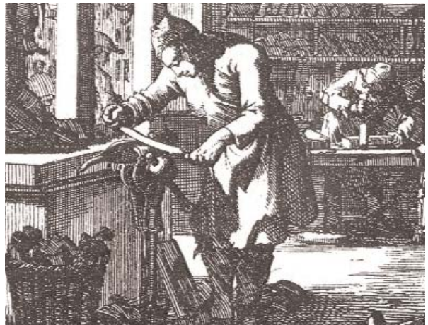
Der "Schlittschubmacher". Stich von Jan Luyken, 1694

Für die geringeren Klassen ist die Eisbahn, wie die Spinnstube bei uns, das Rendezvous der Geliebten. Hier gleiten sie bald 'siegwartisch' Hand in Hand langsam dahin, weit von der lärmenden Menge entfernt, bald trennen sie sich; der Liebhaber zeigt seine Geschicklichkeit in tausend künstlichen Schwankungen und Bewegungen des Körpers und zeichnet, um die empfindsame Szene zu vollenden, den Namen seiner Geliebten mit den Ecken der Schlittschuhe